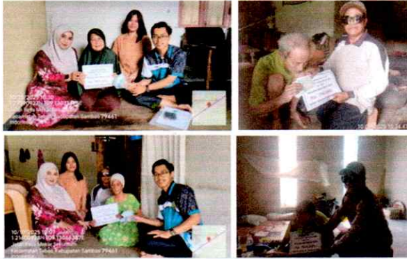
DOKUMENTASI PENYERAHAN BANTUAN LANGSUNG TUNAI (BLT-DD) BULAN OKTOBER TAHUN 2025