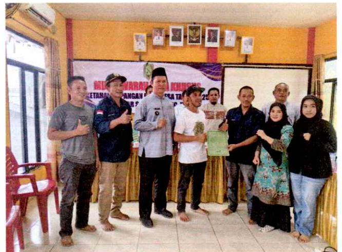
MUSYAWARAH KETAHANAN PANGAN