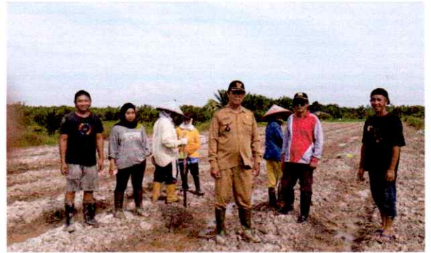
KEBUN JAGUNG (KETAHANAN PANGAN)