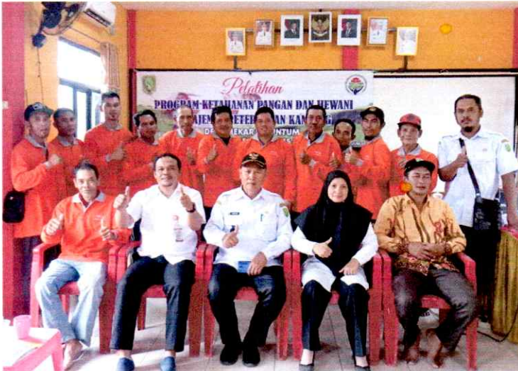
PELATIHAN PETERNAK KAMBING